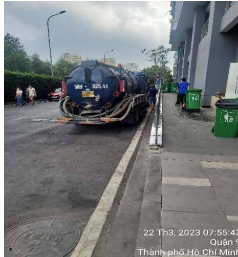
22 Th3, 2023 07:55:43 Quận 9 Thành phố Hồ Chí Minh