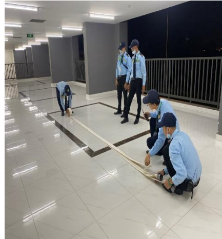
TẬP HUẤN ĐỊNH KỲ - 20/03/2023 THỰC TẬP THAO TÁC CHỮA CHÁY BẰNG CUỘN VÒI