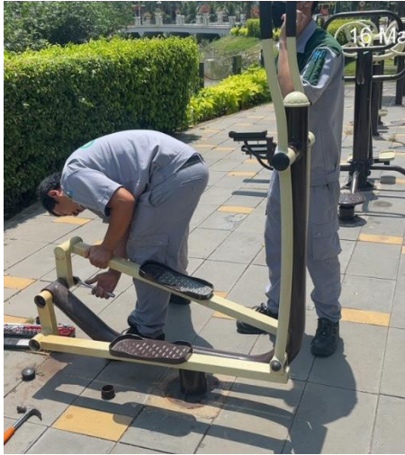
CÔNG TÁC ĐỊNH KỲ - 16/03/2023 SỬA CHỮA THIẾT BỊ KHU VỰC CÔNG CỘNG