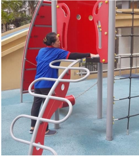
CÔNG TÁC ĐỊNH KỲ - 20/03/2023 VỆ SINH KHU VỰC SÂN CHƠI TRẺ EM