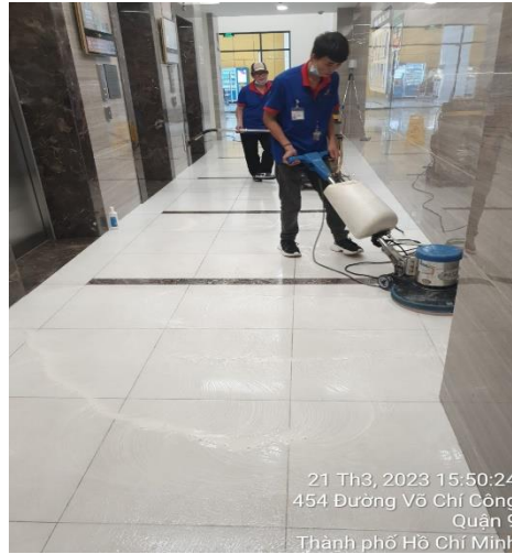
CÔNG TÁC ĐỊNH KỲ - 21/03/2023 ĐÁNH SÀN CÁC TẦNG TÒA NHÀ