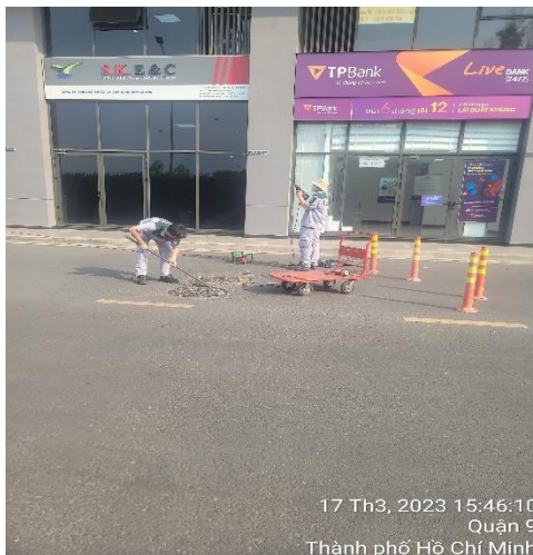
SỬA CHỮA NHỎ - 17/03/2023 XỬ LÝ CÁC NẮP CỐNG