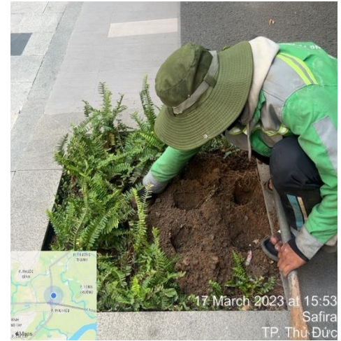
CẢI TẠO CẢNH QUAN TRỒNG DẠM