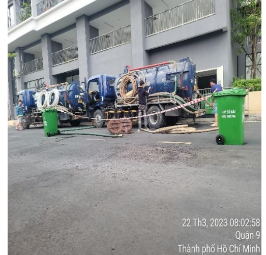
22 Th3, 2023 08:02:58 Quận 9 Thành phố Hồ Chí Minh