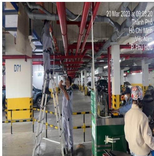
SỬA CHỮA NHỎ- 20/03/2023 THAY BÓNG ĐÈN TẠI TẦNG HẦM ĐỂ XE TÒA NHÀ