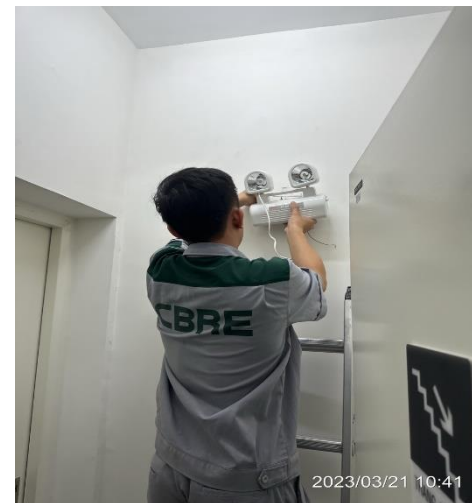
SỬA CHỮA NHỎ 21/03/2023 KIỂM TRA VÀ SỬA THIẾT BỊ