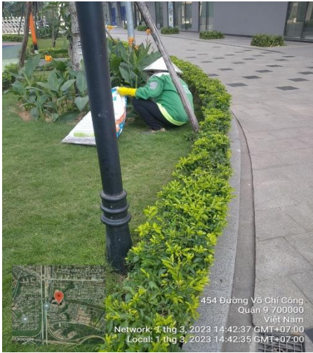
CHĂM SÓC CẢNH QUAN CẮT TỈA CÂY XANH