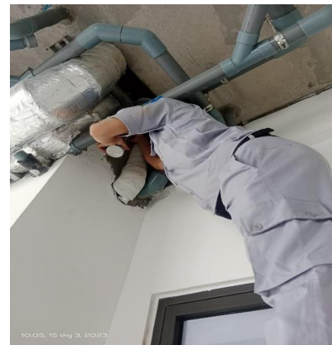
SỬA CHỮA NHỎ - 15/03/2023 XỬ LÝ ĐƯỜNG ỐNG BỊ RÒ RỈ