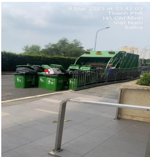
THU GOM RÁC SINH HOẠT - HÀNG NGÀY TỪ 13:00-15:00 THU GOM RÁC SINH HOẠT