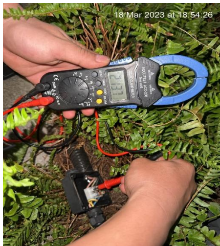
SỬA CHỮA NHỎ - 18/03/2023 SỬA CHỮA THIẾT BỊ ĐIỆN CÔNG CỘNG