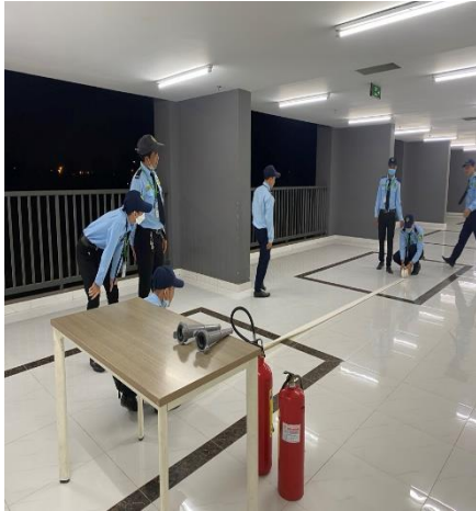
TẬP HUẤN ĐỊNH KỲ - 20/03/2023 THỰC TẬP THAO TÁC CHỮA CHÁY BẰNG CUỘN VÒI