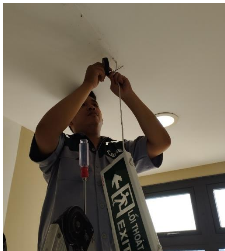
SỬA CHỮA NHỎ - 16/03/2023 KIỂM TRA VÀ SỬA THIẾT BỊ