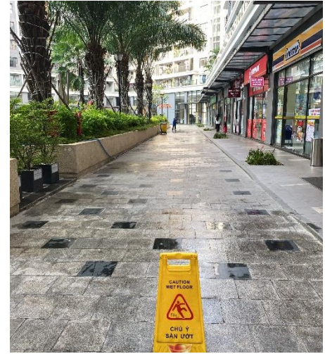
CÔNG TÁC ĐỊNH KỲ - 23/03/2023 VỆ SINH KHU VỰC CÔNG CỘNG CỦA TÒA NHÀ