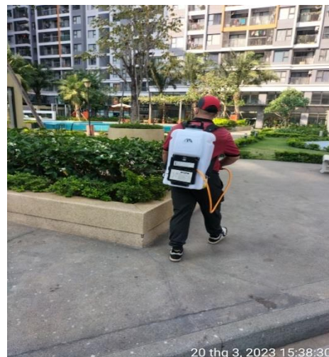
XỬ LÝ CÔN TRÙNG - HÀNG TUẦN PHUN XỊT XỬ LÝ CÔN TRÙNG CÁC TẦNG