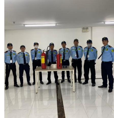
TẬP HUẤN ĐỊNH KỲ - 20/03/2023 THỰC TẬP THAO TÁC CHỮA CHÁY BẰNG BÌNH CHỮA CHÁY